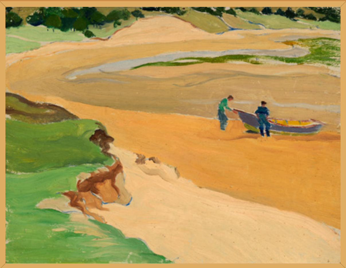
Crique du marais de Plurien , 1947 Huile sur panneau de M. Raffray 26,5 x 35 cm Collection de la famille Raffray