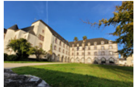
Le musée du Faouët

Parallèlement à la présentation de ces rétrospectives, le musée du Faouët a conduit, depuis le milieu des années 90 une active politique d'acquisition qui, concrètement, a abouti à multiplier par quatre le nombre des œuvres conservées au sein de la collection.