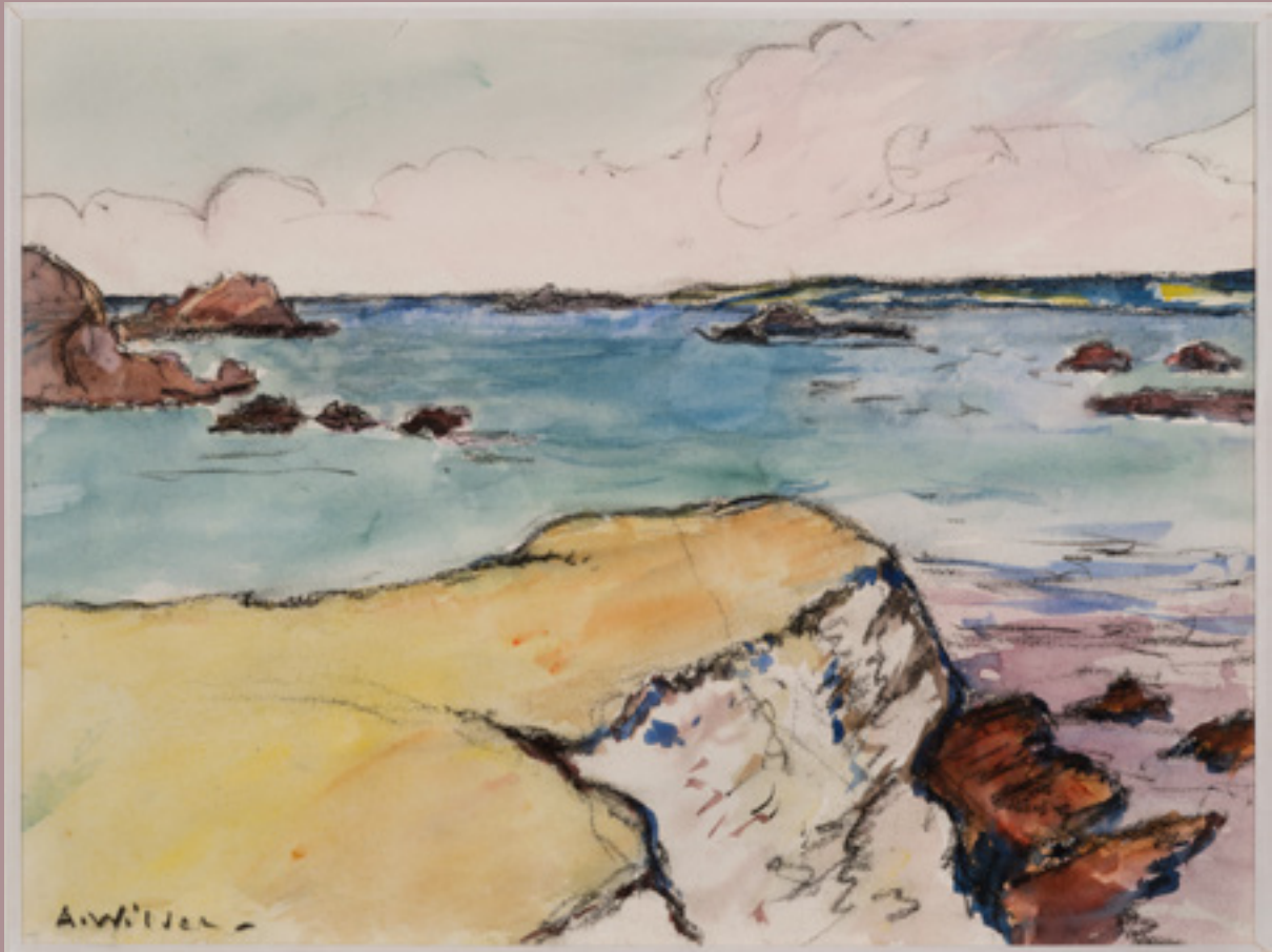
La Pointe de Beg-en-Aud, Portivy, Saint-Pierre-Quiberon Aquarelle, gouache et fusain sur papier d'A. Wilder 26 x 34 cm Collection particulière © Droits réservés © Cliché : F. Doury