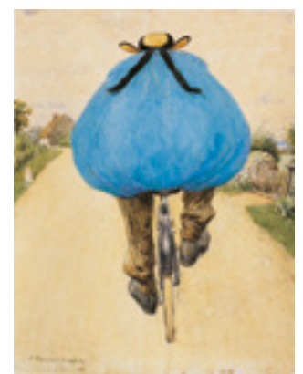
Le Cultivateur mécanique, 1906 Sydney Curnow Vosper (1866-1942) Aquarelle sur papier – 23 x 18 cm