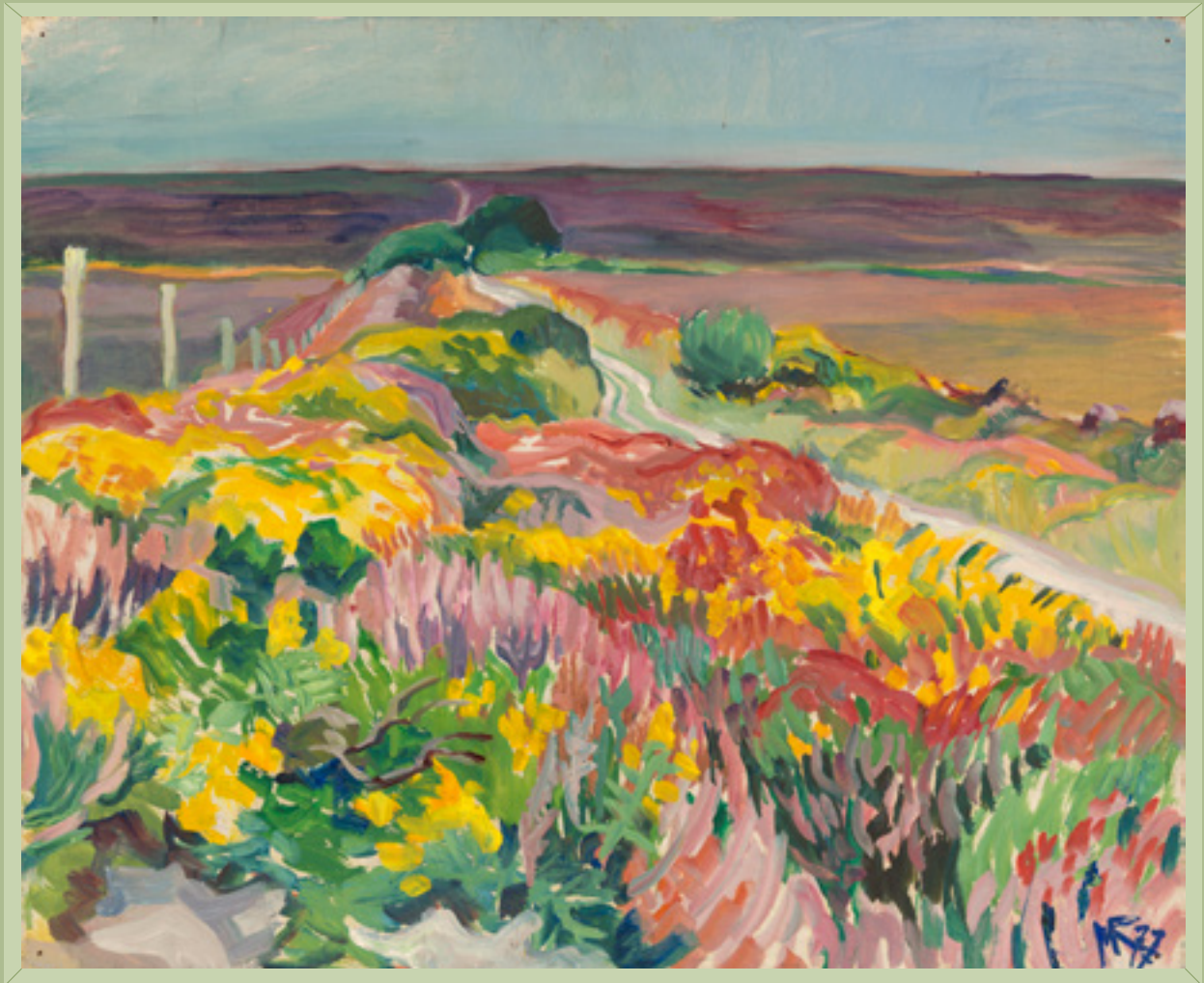
Sentier dans la lande fleurie. Cap Fréhel, 1977 Huile sur panneau de M. Raffray 38 x 46 cm Collection de la famille Raffray